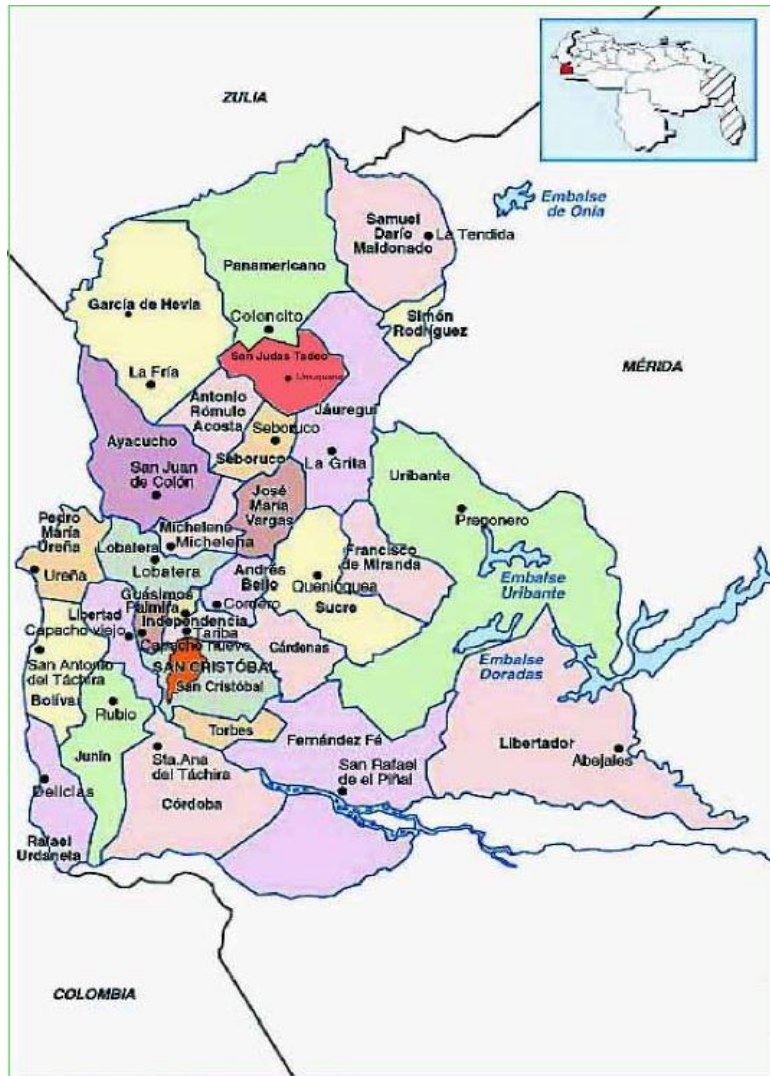
Figura 1: Mapa político-territorial del Estado Táchira