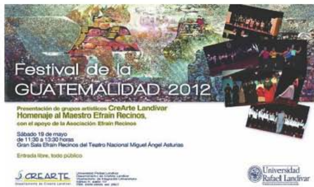
Festival de la Guatemalidad.