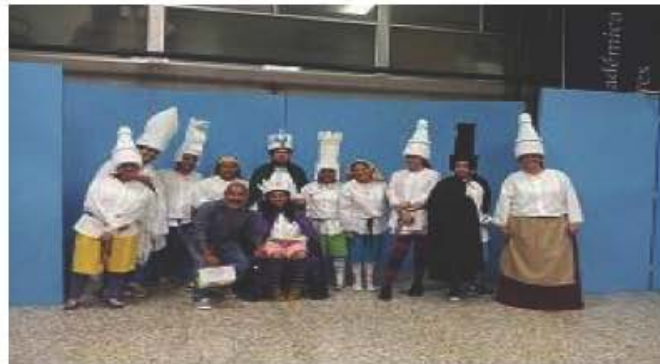
Semana Ignaciana.