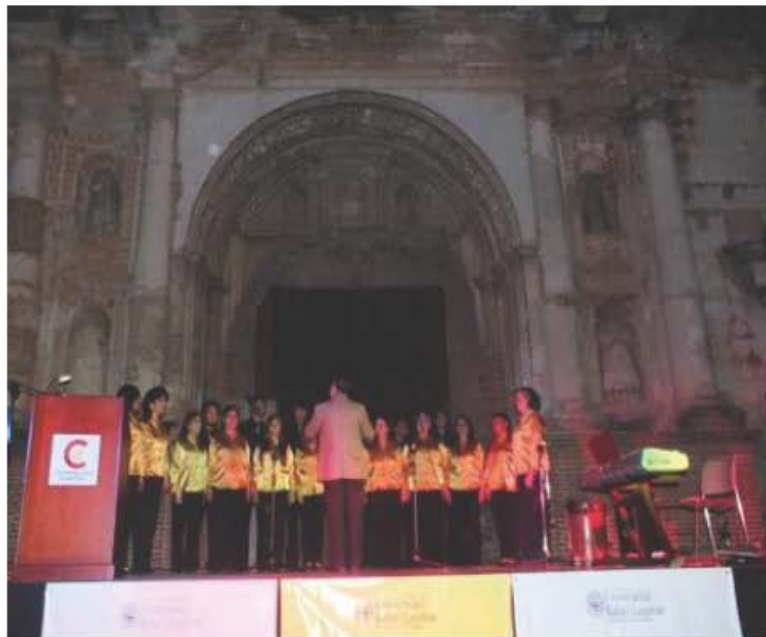
I Ensemble coral, Fotografía Gabriela Lickes.