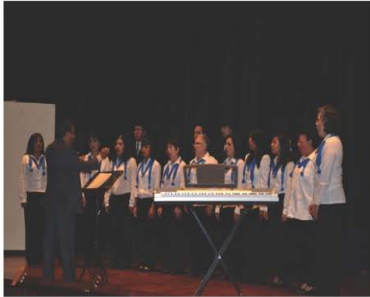
Festival de la Guatemalidat