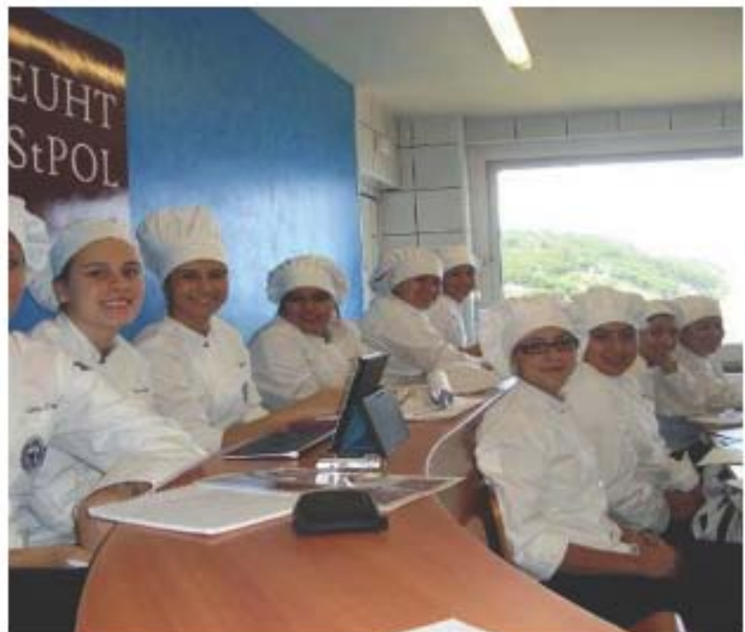
Fuente: Dirección de Cooperación Académica. Estudiantes en programa de verano