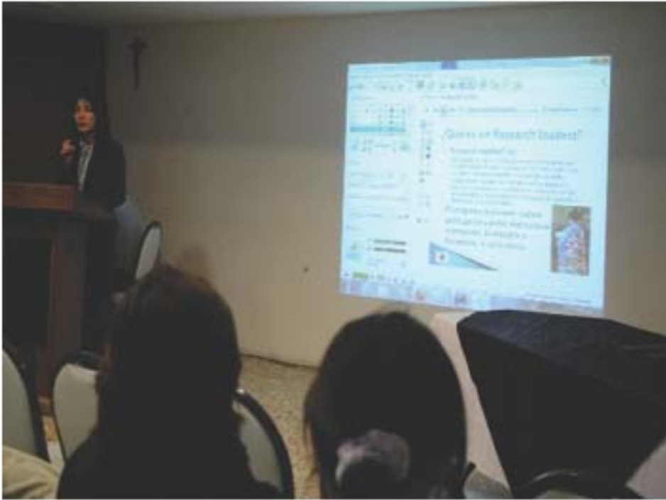
Conferencia de becas de Japón