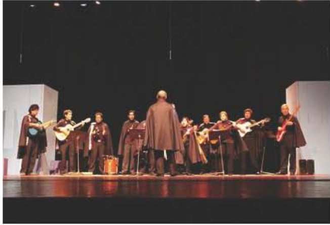
II Encuentro Landivariano.