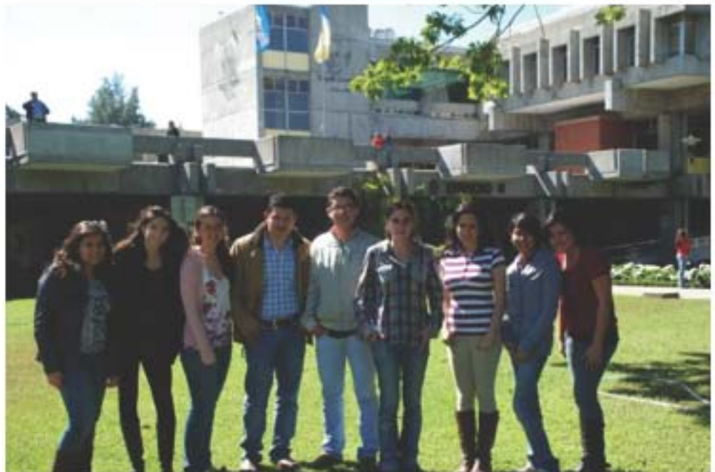
Fuente: Dirección de Cooperación Académica. Intercambio estudiantil primer ciclo