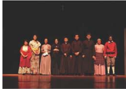
Festival de la Guatemalidad.