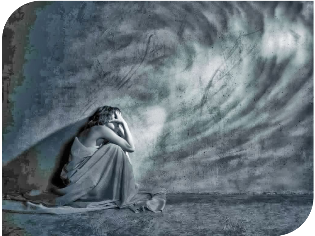
Depresión (2013).

Es importante recordar que un trastorno del estado del ánimo puede afectar a cualquier persona, de cualquier entorno, edad y nivel socioeconómico.