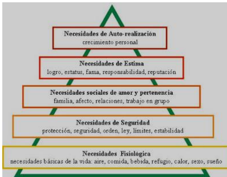
Figura 2. Pirámide de las necesidades de Maslow Adaptado de Chapman (2007).

es el cumplimiento del potencial personal a través de una actividad específica; de esta forma una persona que está inspirada para la música debe hacer música, un artista debe pintar, y un poeta debe escribir. (Quintero, 2011)