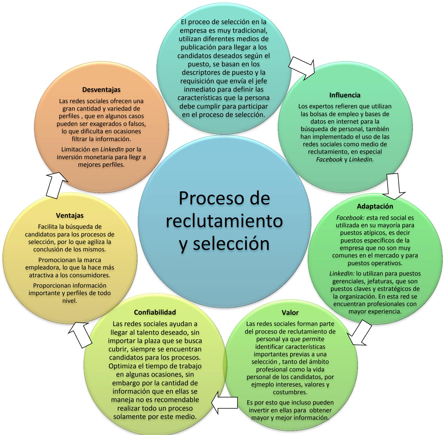
Esquema 4.1 Análisis de resultados