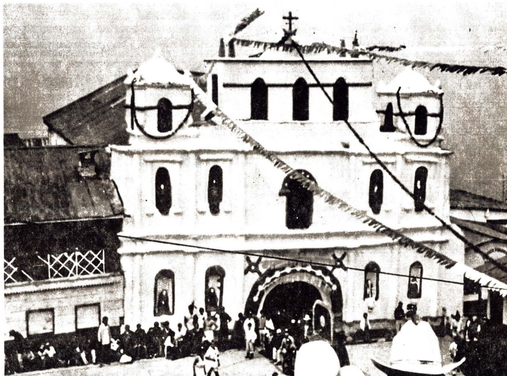
Iglesia de San mateo Ixtatán, Huhuetenango, Guatemala.

Dentro del emplazamiento colonial conviene mencionar cómo se estructuraron los intereses económicos en esta región, lo cual reflejará en parte las condiciones que se tejieron en las relaciones sociales establecidas entre los colonizadores españoles y sus recientes súbditos. Como lo menciona Wendy Kramer (1994), en la implantación de la empresa colonial, la creación de las encomiendas jugó un papel clave en la difusión del establecimiento racional y la consolidación de la cultura de la conquista 98 , y aún para lugares considerados no centrales, como el que nos ocupa, ésta fue bastante temprana. En efecto, en Huehuetenango desde los primeros momentos de la colonia e incluso antes de terminar la conquista, se distribuyeron las encomiendas –Ver cuadro No. 12-.