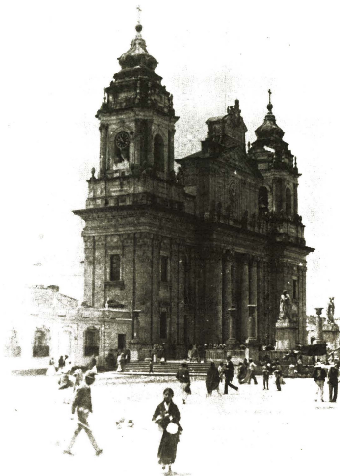
“Por el Barrio del Sagrario, frente a la Catedral, los apóstoles de piedra cubiertos de sombra, parecían papel molido. . .”. Catedral Metropolitana de la Nueva Guatemala antes de los terremotos de 1917-18.