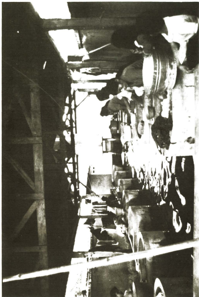
“Y entre cantos y chismes, el tiempo y la vida se les iba resbalando a las lavanderas del Barrio de Candelaria”. Diciembre, 1975. (Fotografía: Mauro Calanchina).