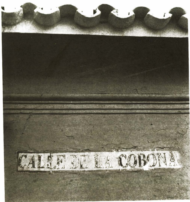
"De pronto, de lo profundo de la Calle de la Corona. . .". Calle de la Corona. Diciembre, 1975.