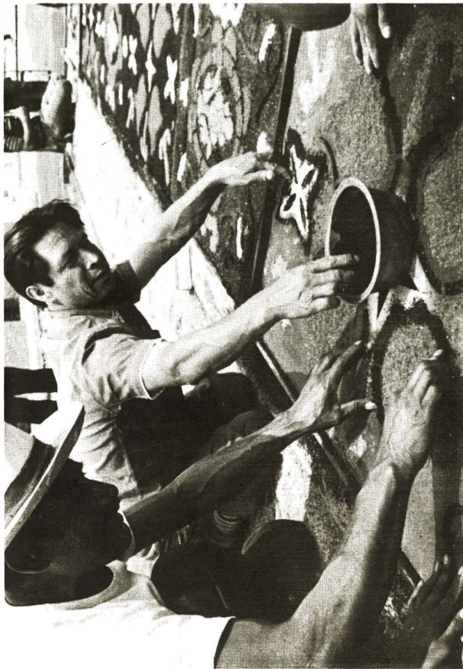
“Sobre la calle de San José dos hombres trabajaban afanosos en la elaboración de una alfombra de aserín. . .” Barrio de Candelaria. Semana Santa, 1976 (fotografía: Mauro Calanchina).