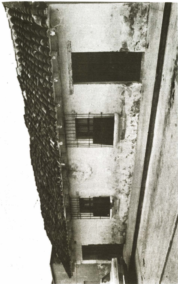
“Y la voz del carbonero entraba por la rendija de la puerta y colmaba toda la casa y el barrio completo”. Callejón del Colegio. Barrio de la Recolectión. Diciembre, 1975.