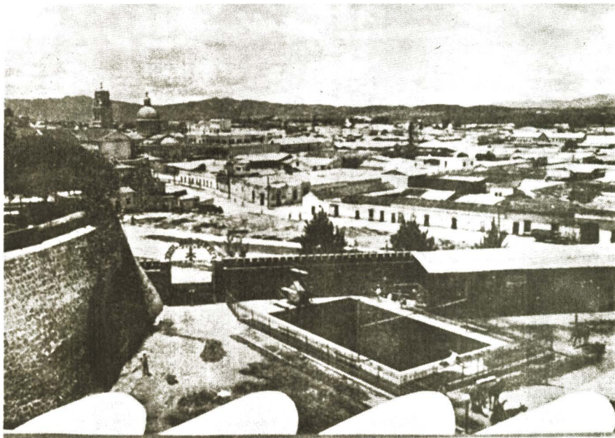
“Caminó, caminó y caminó por las aceras de laja y las calles empedradas de la ciudad. . .”. La Nueva Guatemala desde el Fuerte San José. Principios del siglo XX..