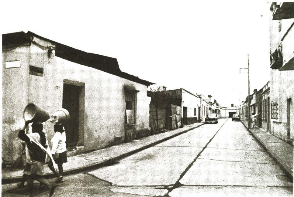
“...el caballo se dirigió a los establos de Schumann,..”. Callejón de la Cruz. Al fondo los establos de Schumann. Barrio de Santa Catarina. Diciembre, 1975.