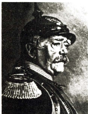
Con Bismarck, en la década del 80 del siglo pasado, surge la política social como una forma de contrarrestar las luchas revolucionarias.

mática. De ahí en más el sistema capitalista frente a las reclamaciones obreras no utilizará en exclusiva (en los países industrializados) la política del «garrote»; esta será alternada con la política del «caramelo», es decir, con la implementación de una política social a favor de la clase trabajadora. El tándem Guillermo I-Bismarck son los primeros en realizarla. El mensaje del Emperador (27 de noviembre de 1881) ante el Reichstag lo dice muy claramente: «la curación de los males sociales no debe buscarse de modo exclusivo por los senderos de la represión de los desmanes cometidos por los social-demócratas, sino, de modo regular, mediante el positivo estímulo del bienestar obrero». (Digamos para comprender este texto, que en esa época toda forma de protesta era atribuida a los social-demócratas; hoy los «culpables» son otros).