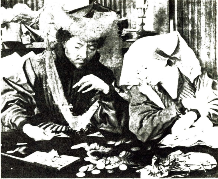
«El cambista y su mujer». Retrato de M. Reymerswaelc (siglo XV). Mercaderes y banqueros son los máximos representantes de la burguesía emergente.

privilegiada pero tampoco sujeta al señor feudal— van adquiriendo una importancia cada vez mayor, tanto en la vida económica como en la vida política.