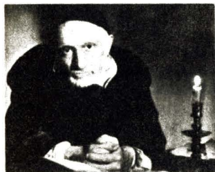
Vicente de Paül

En el caserío de Ranquines, cerca de Dax en el sur-oeste de Francia nació Vicente de Paül el 24 de abril de 1581. Hoy, después de más de 400 años su nombre sigue siendo mencionado —al margen de su significación religiosa— como uno de los precursores de la ayuda social organizada. Supo conciliar las motivaciones religiosas de la acción con la eficacia organizativa.