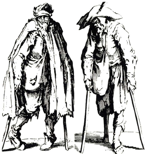
«Los pobres son nuestros hermanos y maestros». (Mendigos del tiempo de San Vicente, según grabados de Jacques Callot, siglo XVII).

Durante todo este período se da una evolución que va, desde la acción benéfica-asistencial con motivaciones más o menos moralistas-religiosas, hasta la filantropía que es una versión laicizada y racionalizada de la caridad cristiana.