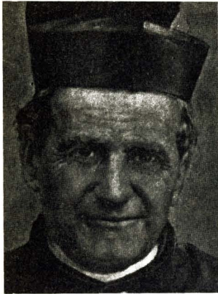
Juan Bosco, precursor de la acción social dentro de la Iglesia, inició muchas y variadas obras para la ayuda de los pobres.

Por su parte, San Juan Bosco que tanto hizo por los niños de la ciudad de Turín que se iba industrializando a mediados del pasado siglo, para mover a los ricos a que ayudasen a los necesitados, utilizaba este tipo de argumentación: «Los pobres corren el peligro de ser arrastrados por la revolución, porque la miseria es inaguantable. Esa situación es indigna de un pueblo cristiano. Los ricos han de poner sus riquezas al servicio de los pobres. Si no lo hacen así, no son cristianos. Los pobres impelidos por la miseria pretenderán dividir la riqueza «poniendo la punta del cuchillo