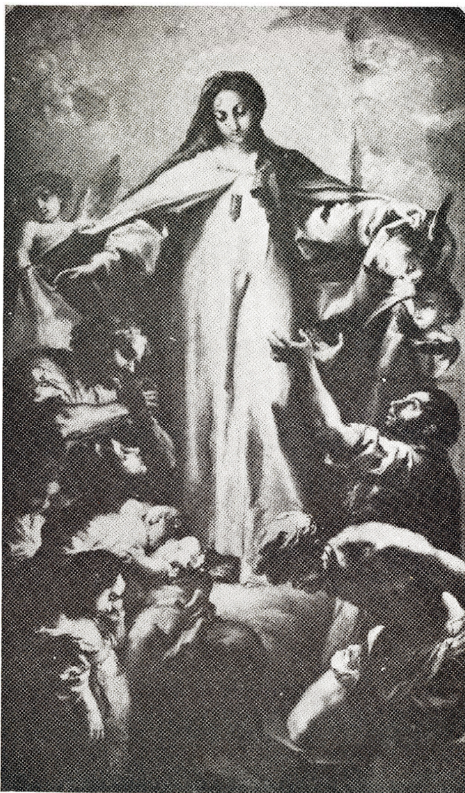
La Virgen de La Merced protege con su manto y recibe bondadosa las súplicas de los que sufren cautiverio. Cuadro de Vicente López, Museo Provincial de Valencia, España.