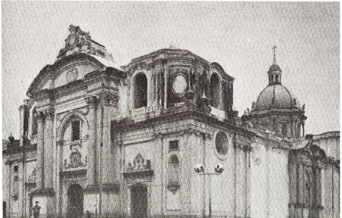
Fachada de la iglesia La Merced, Ciudad de Guatemala. Foto: I. Zúñiga, 1963 y 1969.