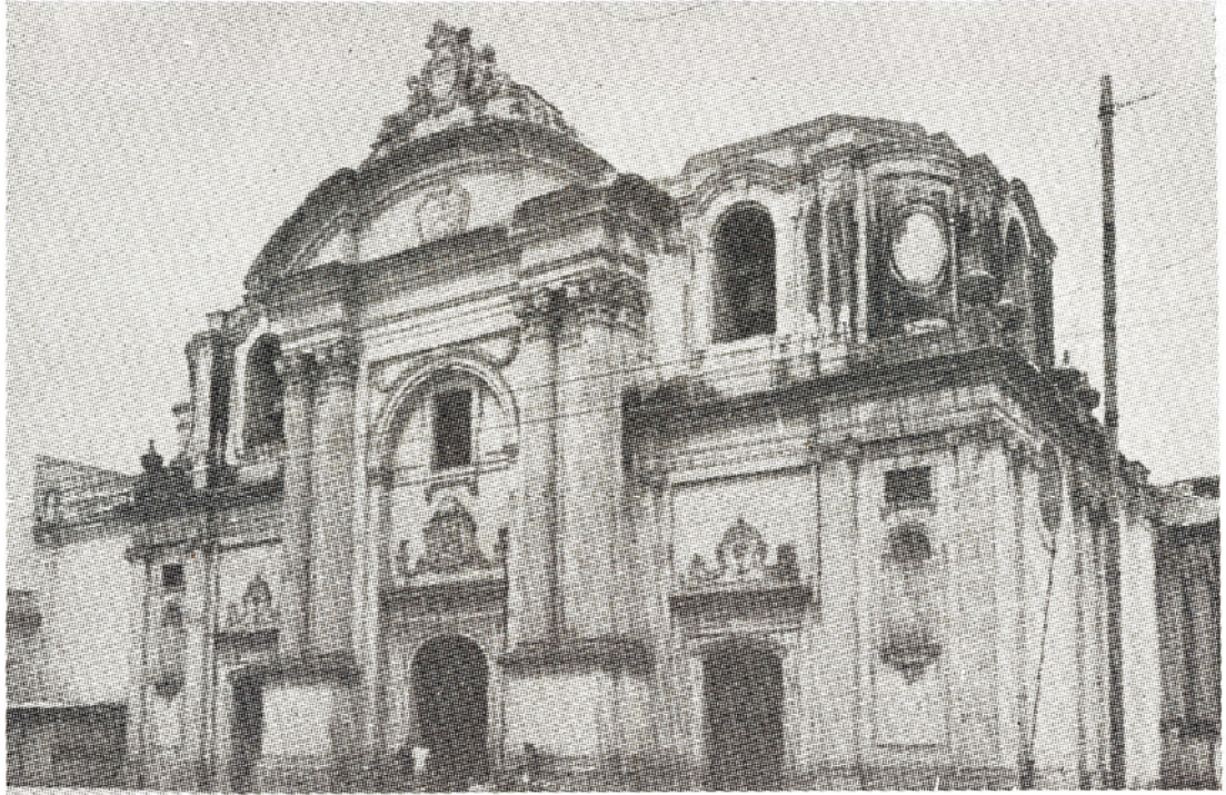
Fachada de la iglesia La Merced, Ciudad de Guatemala. 1963 y 1969.